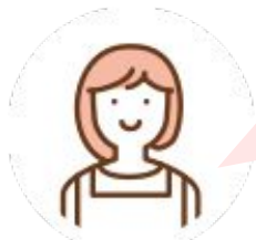
すみわたる保育園様